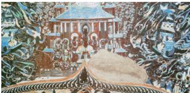
图1 莫高窟第419窟弥勒上生经变局部